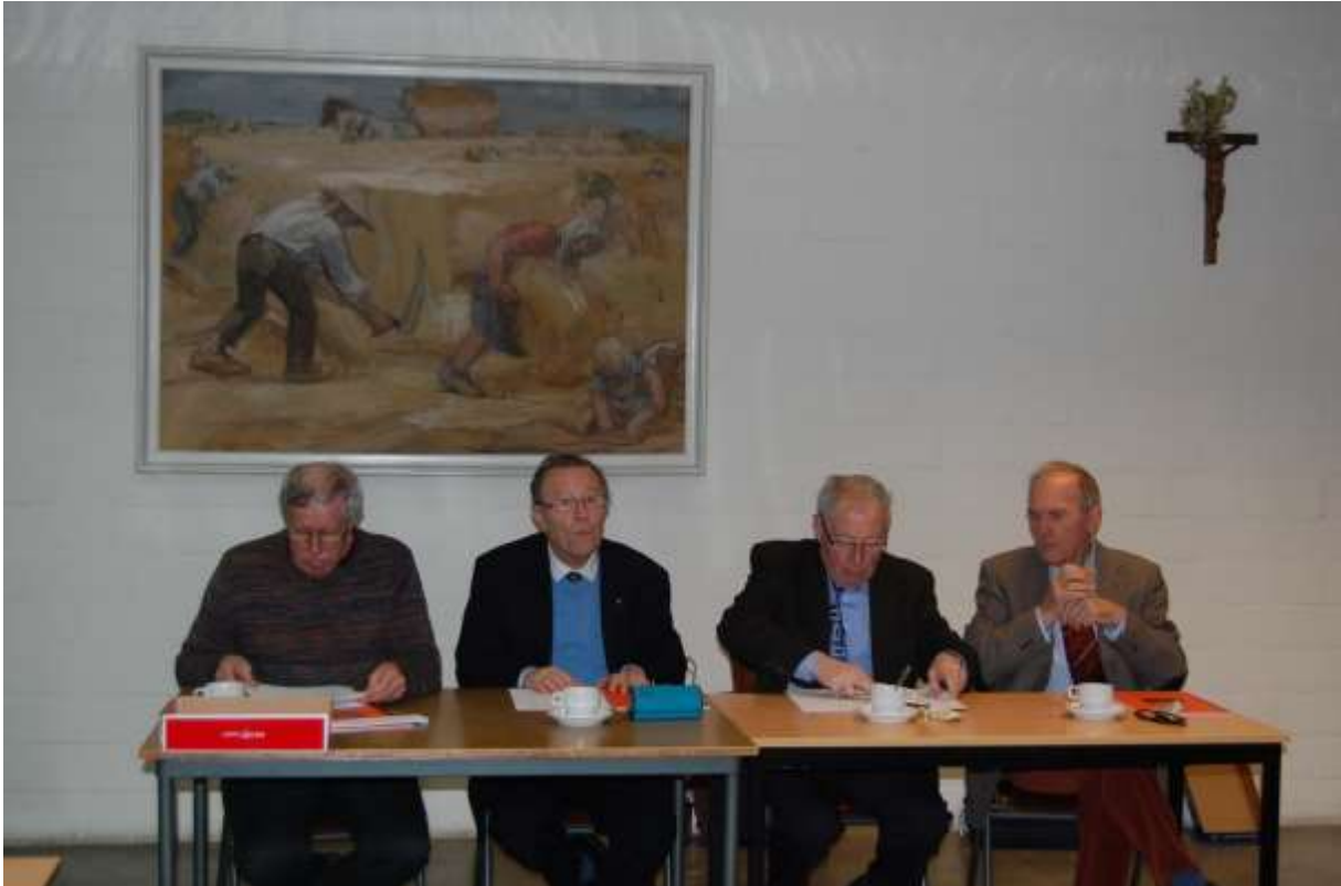
Foto 3 - Secretaris, voorzitter, penningmeester en ondervoorzitter. Zie de colofon om naam en/of e-mailadres te kennen.